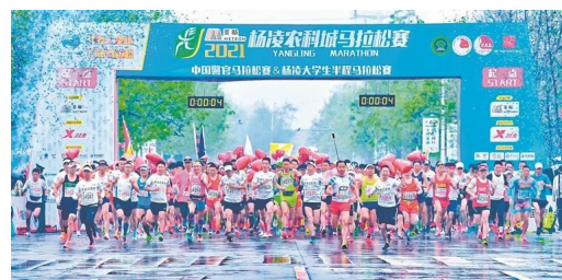
杨凌农科城马拉松赛起跑现场。

杨凌农科城马拉松赛创办于2015年,已成功举办八届,有近20万名跑友奔跑在杨凌这片希望的田野上。“杨马”先后跻身全国九大马拉松锦标赛、中国田径协会A类金牌赛事、世界田联标牌赛事之列。如今,“杨马”并不仅仅只是一场马拉松比赛,它更多地融入了杨凌传统农耕文化的元素和现代旅游的符号,让来自国内外的参赛者真切地感受到了这座城市的底蕴和温度。杨凌农科城国际马拉松赛与杨凌农科城自行车赛、杨凌网球系列公开赛、杨凌水上系列赛事已经形成“跟着赛事去旅行”的