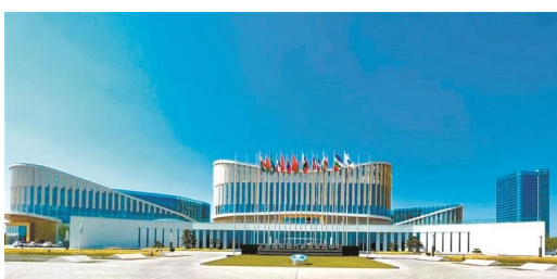
上合组织现代农业交流中心。

2019年6月14日,国家主席习近平在上海合作组织成员国元首理事会第十九次会议上发表重要讲话,提出在陕西省设立上海合作组织农业技术交流培训示范基地,加强同地区国家现代农业领域合作这一倡议。5年来,杨凌示范区充分发挥“培训、交流、示范”主体功能,构建“一基地多平台、一中心多园区、一院多所”平台体系,相继建成上合组织现代农业交流中心、20个境内外实训基地等平台载体。先后承办上合组织现代农业发展圆桌会、中国—中亚农业部长会议等多边机制性活动,为上合组织国