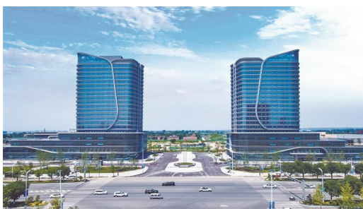
陕西杨凌综合保税区。

建成全国首个服务于农业产业的综保区——陕西杨凌综合保税区,并以此为基础创新推进国家(杨凌)种质资源引进中转基地、药用植物进境绿色通道等对外开放平台建设。作为全国唯一的农业特色鲜明的自贸片区,挂牌7年来,杨凌已累计形成70多项系统集成性较好的创新案例,其中7项案例在全国复制推广,15项改革创新成果在全省复制推广,17项案例被评为我省自贸试验区“最佳实践案例”,营商环境建设成绩斐然。