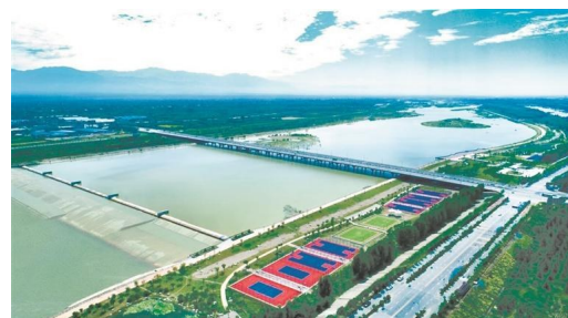
杨凌渭河大桥二号橡胶坝。

杨凌渭河综合整治工程自2011年启动实施,充分融入农耕文化、水文化,建成两级景观蓄水工程,水面面积约5500亩,滩地生态公园约1000亩,配建各类体育设施场地5万平方米,形成了独具杨凌特色的渭河生态景观,对提升杨凌城市品位、加快推进“园林杨凌”建设具有重大意义,先后被评为省级水利风景区、国家3A级旅游景区。