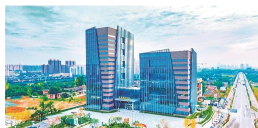
杨凌种业国际大厦。

杨凌是中国四大种业创新基地之一,育种水平全国领先。多年来,审定通过的1100多个新品种被推广到23个省区,小麦和玉米系列新品种累计推广面积超过8.5亿亩、增产430亿斤。推动形成了我国玉米第四大产区——西北产区。连年举办跨省区新品种观摩会,在中西部主粮产区建立了40个良种良法示范园,辐射带动粮食生产提质增效。小麦赤霉病和条锈病防治技术世界领先,使全国小麦条锈病发病面积降低51%,每年挽回小麦损失40