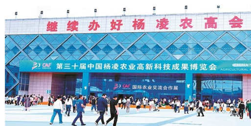
第三十届杨凌农高会现场。

杨凌农高会创办30年来,始终秉承服务“三农”的初心,办会规模逐步扩大,层次和水平逐年提高,农业国际合作不断深入,累计吸引了来自全国34个省(区、市)以及澳大利亚、加拿大、以色列等70多个国家和地区的上万家涉农企业和科教单位参展,3000多万客商和群众参展参会,参展项目及产品超过18万项,累计促成投资与交易额超过170亿元。近几年,每年参展参会人数均在150万人次以上,已经成为“专家教授认可、农业企业信赖、广大农民喜爱”的