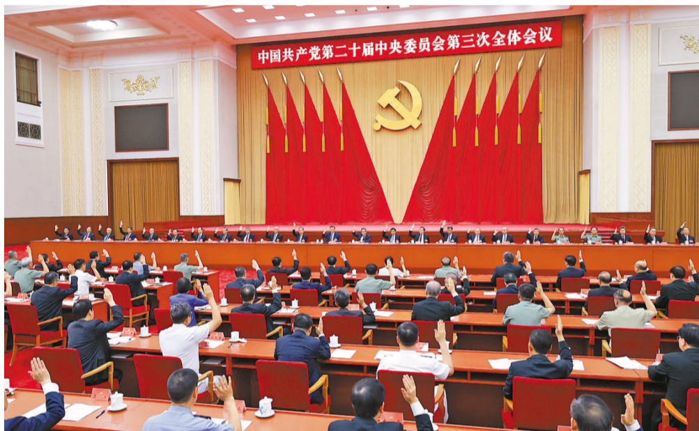
中国共产党第二十届中央委员会第三次全体会议,于2024年7月15日至18日在北京举行。中央政治局主持会议。

新华社北京7月18日电 中国共产党第二十届中央委员会第三次全体会议公报(2024年7月18日中国共产党第二十届中央委员会第三次全体会议通过)